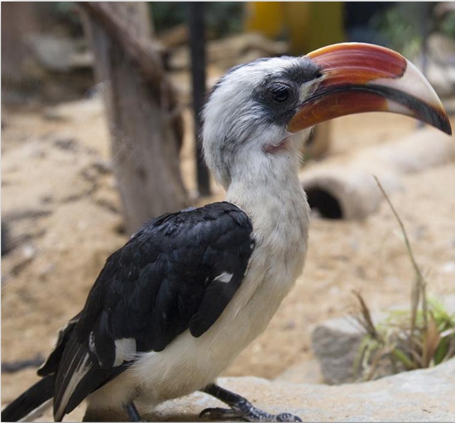
Toco de Von der Decken